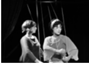
Ne Dormir Que d'Un Fil, 2003