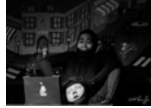
Bon an, Mal an (saison 4), 2015