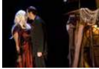
Avec moi le Déluge, 2010